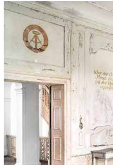
Die kommunistische Ära hat hier viele Spuren hinterlassen. Auch sie sind Teil der Geschichte dieses Ortes und wurden deshalb erhalten.