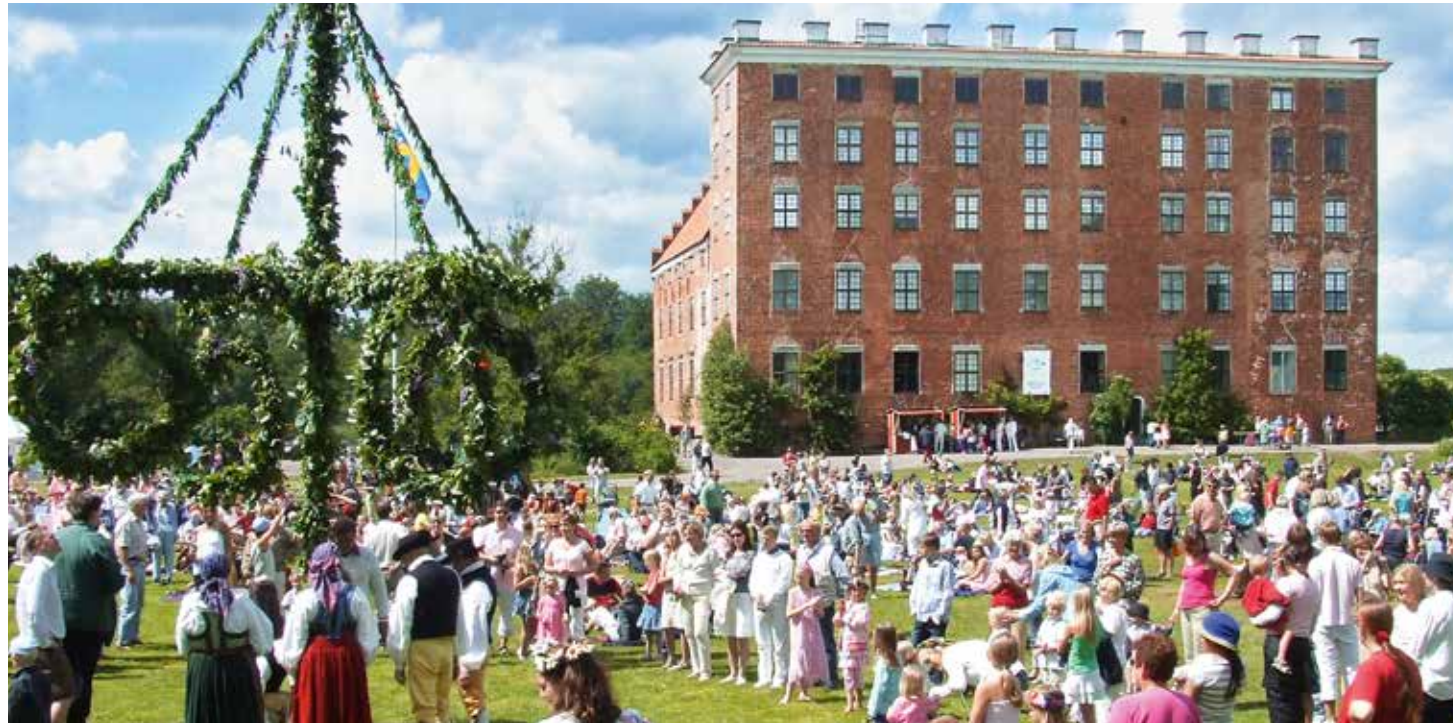
Mittsommer ist eines der beliebtesten Feste der Schweden: Natürlich wird es auch in Svaneholm gefeiert. Besucher sind herzlich willkommen.