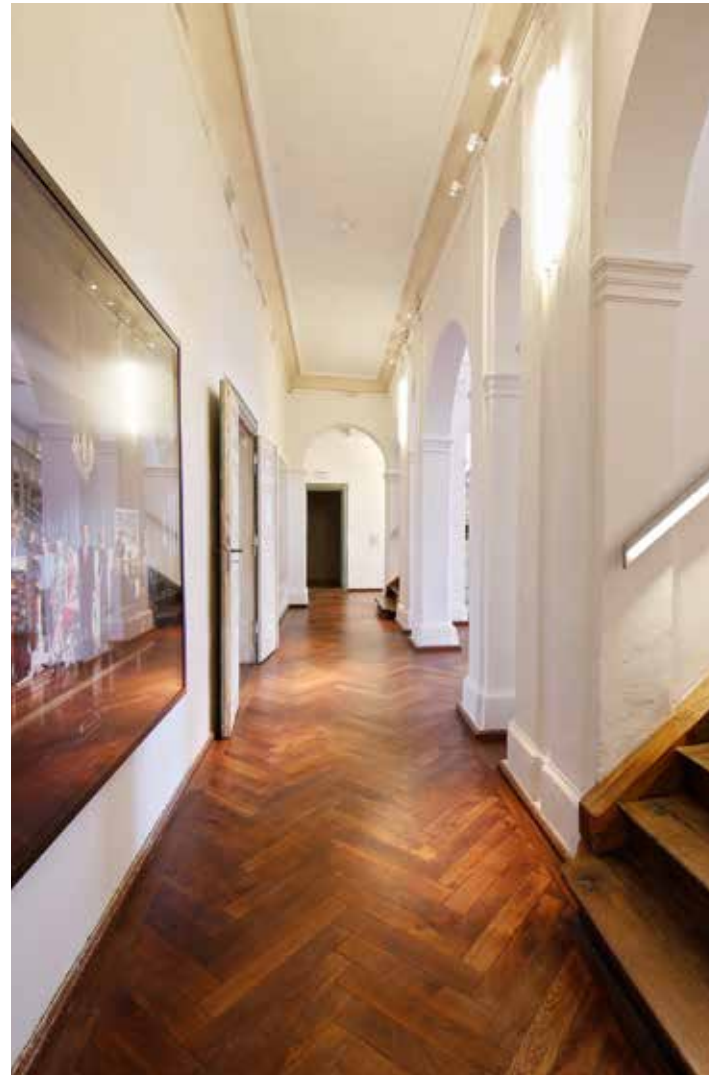
Die Großzügigkeit der Architektur dieses Gebäudes bietet den perfekten Rahmen für großformatige Fotografien.

Am Ufer des gleichnamigen Sees gelegen, ist Schloss Kummerow eines der bedeutenden Fotomuseen Deutschlands geworden. Mit Hilfe eines aufwändigen Restaurierungsprozesses konnte die bewegte Vergangenheit des Hauses kunstvoll sichtbar gemacht werden. Mit Mut zum Makel entwarfen Torsten Kunert und sein Architekt ein Konzept, das bewusst mit den Missetaten an der alten Substanz spielt und sie nicht zu vertuschen versucht. Der Charme dieses Gebäudes offenbart sich in einem Zusammenspiel aus Nutzen und Schönheit: Gedrechselte Treppen, Stuckelemente, handbemalte Tapeten. Einem so vom langjährigen Leerstand mitgenommenen Haus wie Schloss Kummerow wieder zu neuem Glanz zu verhelfen, ist eine hochsensible Angelegenheit – vor allem, weil die Denkmalbehörden involviert sind. Über allen Entscheidungen steht eine zentrale Frage: Wie viel kann und sollte von dem historischen Charme erhalten bleiben? Es ist