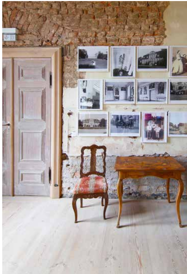
Natürlich ist auch das Schloss Kummerow äußerst fotogen und deshalb Teil der Ausstellung.

Der Geist hier besagt einerseits, dass man mit dem Strom schwimmen sollte – aber nur bis zu einem bestimmten Punkt. Dann gilt es, rechtzeitig abzubiegen, um sein wahres Ich zu finden. Dieses Schloss steht für mich voll und ganz für diese Art des Denkens und es spiegelt das Wesen meines Vaters wider.“