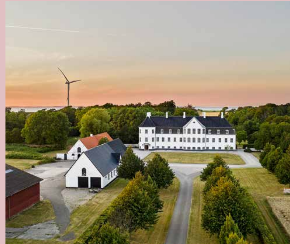
Das unmittelbar an der Küste gelegene Frederiksdal ist das typische Ostsee-Gutshaus par excellence.

Gutshaus Frederiksdal in Lolland-Falster