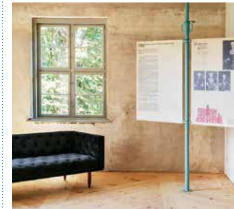
Transparente Geschichte war das Ziel der Schlosssanierung und ist auch das Thema der dortigen Ausstellung.