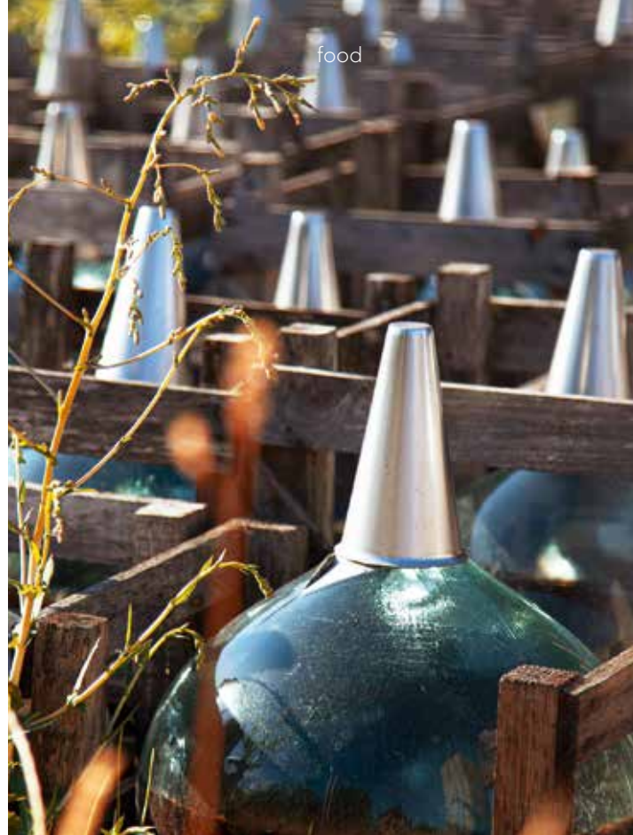
Der Wein wird im Freien gelagert, damit Sonne, Regen und Kälte ihm seinen besonderen Geschmack verleihen.

Eingeläutet wurde diese Reise mit einem dreiwöchigen Roadtrip, bei dem sich das befreundete Trio durch die Welt des Weins trank, in Frankreich, Spanien und Italien. „Ich würde sagen, wir sind so etwas wie Seelenverwandte, wenn es um Essen und Wein geht. Wenn wir aus einhundert