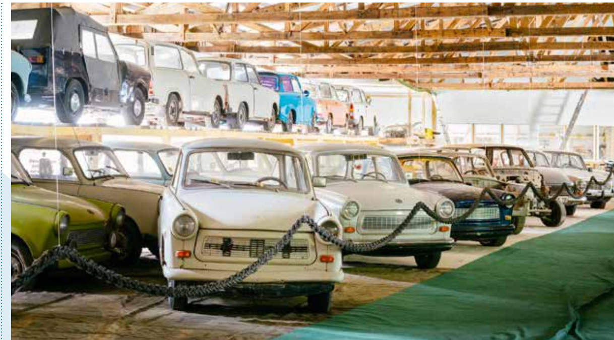
Im Nebengebäude des Wasserschlosses befindet sich der „Trabbi-Club“, wo mit viel Herzblut die alten Fahrzeuge repariert und gewartet werden.

Das Projekt und die Unterstützung der Stiftung Kulturerbe M-V haben mir unglaublich viele Einblicke in die Berufe gegeben, die sich mit der Rettung alter Gutshäuser beschäftigen. Ich habe viel gelernt. Man muss seine Bedürfnisse hintanstellen können, wenn man in einem alten Haus leben will. Wir haben jahrelang ohne Heizung im Bad gelebt, haben drüben im Verwalterhaus, das wir jetzt an Gäste vermieten, nur mit Öfen geheizt.