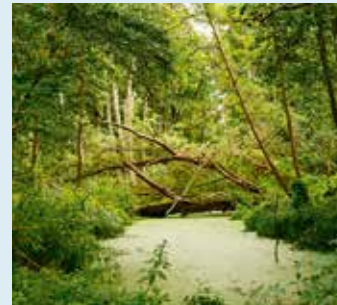
Verwunschene Natur prägt die Szenerie rund um das Wasserschloss.

Gut. Wir haben es uns ja ausgesucht. Wir wollten Ruhe und Abgeschiedenheit, nachdem wir jahrelang in Berlin gelebt hatten. Der Deal war: Wir betreuen den Bauprozess und können danach mit der fertigen Anlage Geld verdienen. Es ist eine schöne Aufgabe, sich um diese Anlage zu kümmern, und das schon seit acht Jahren. Dass wir damit etwas Neues in einem solchen Ausmaß entstehen lassen würden und zu Raumpionieren werden, war uns nicht bewusst. Aber es macht Spaß.