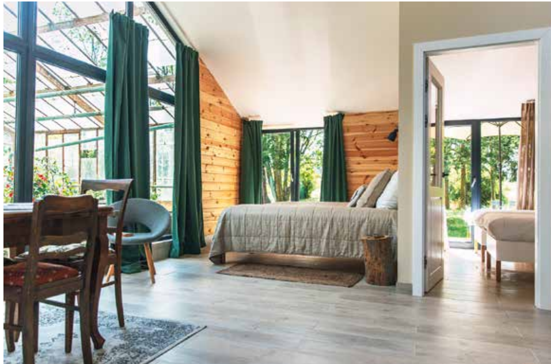
Insgesamt besticht Jackowo durch den Charme des Unfertigen. Die Ferienwohnungen hingegen wurden neu errichtet – und versprühen auch diese besondere Jackowo-Atmosphäre

Was für eine Aussicht: Von einigen der Wohnungen blickt man direkt in das zauberhafte alte Gewächshaus.